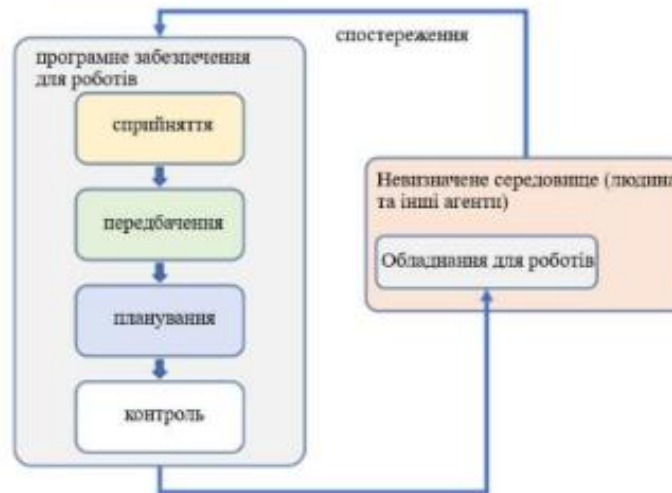
Рисунок 1 – Взаємодія модульної роботизованої системи та навколишнього середовища

Модуль прогнозування приймає оброблені сигнали і робить прогнози середовища, такі як майбутні рухи оточуючих агентів або оцінки неспостережуваних станів агентів, таких як їхні наміри.