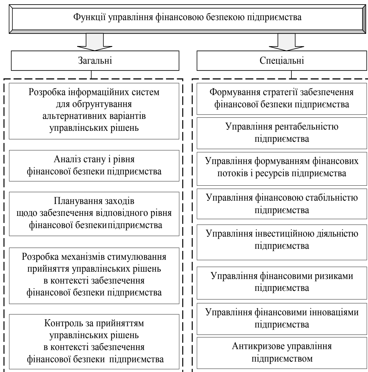
Рисунок 2 – Функції управління фінансовою безпекою підприємства