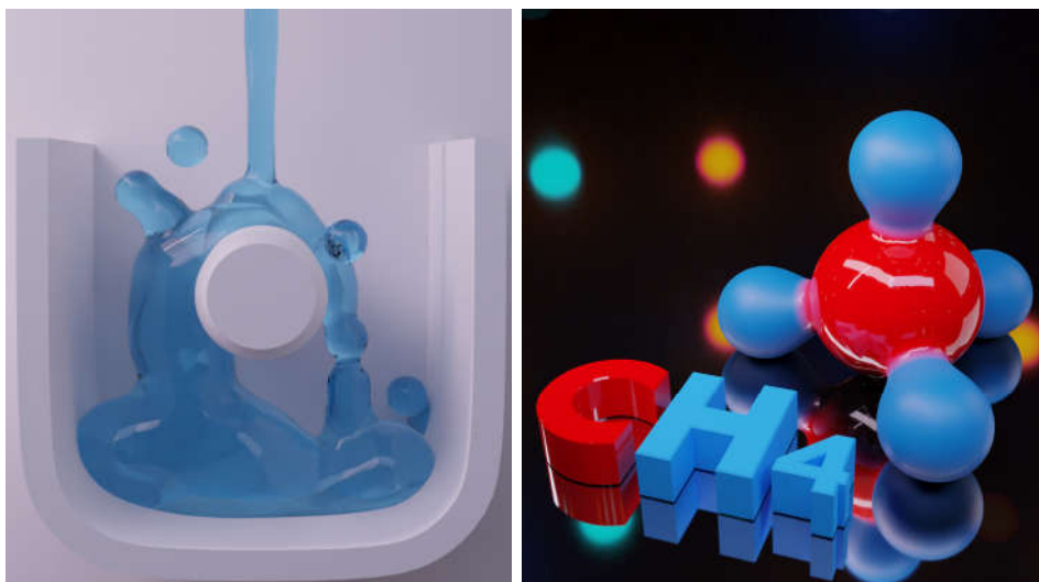
Рисунок 2 – Имитация жидкостей, создание визуализаций решетки молекул

Также комбинируя эти методы работы со стандартными возможностями редактирования metaballs, такими как негативность, возможность менять зону взаимодействия и размер [1], можно создавать и редактировать сложные объекты. Одной из особенностей metaballs представленной в 3d-пакетах является возможность изменять их разрешение в процессе работы, это позволяет работать и редактировать такие структуры на слабых вычислительных устройствах.