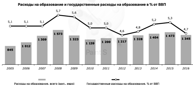
Рис. 2 Динамика инвестиций в образование [6]

12 и 13 марта 2019 года в Брюсселе состоялась встреча рабочей группы Европейской комиссии по образованию взрослых, основной целью которой была разработка идей о возможном направлении политики непрерывного образования в Евросоюзе после 2020 года. В презентации Еврокомиссии был также проведен анализ уже реализованного и прозвучали главные выводы, один из которых звучит так: показатели взрослого населения, вовлеченного в непрерывное образование ниже, чем были обозначены в целях для стран-участников Болонского процесса. Рабочая группа подтвердила, что проблемы похожи во всех странах. Например, в Латвии необходимо увеличить мотивацию участников непрерывного образования, особенно среди малоквалифицированных жителей. Похожая ситуация и в Швеции, где много малоквалифицированных работников. По мнению рабочей группы, на данный момент в странах-участницах в сфере образования большее внимание уделяется высшему и профессиональному образованию, а не образованию взрослых. [1]