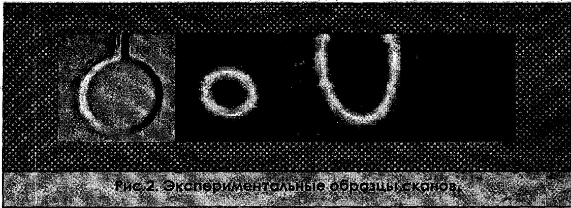
Рис. 2. Экспериментальные образцы сканов

Локализация местоположения предметов, которые обнаруживаются, может осуществляться с точностью не хуже 15...20 мм, при этом определяется форма предметов и их контур, а также может быть классифицирован материал, из которого они изготовлены. Задача классификации металлов решается по изменению толщины скин слоя, путем одновременного зондирования несколькими (двумя-тремя) избранными частотами. Область сканирования может быть разная, например она может составить 2000×900мм 2 . Время полного сканирования составляет, около 20 сек. Общая обработка сигналов магнитных датчиков и видеокамеры, позволяет вывести на экран монитора изображения человека и обозначить специальной подсветкой местоположение, где находится у него оружие.