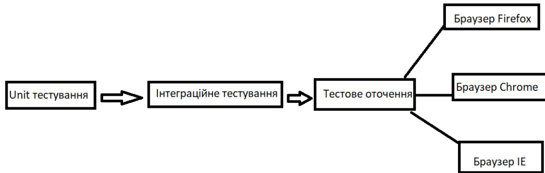
Рисунок 2 – Процес конфігураційного тестування

Тестування GUI – це тип тестування програмного забезпечення, який перевіряє графічний інтерфейс користувача програмного забезпечення. Мета тестування графічного інтерфейсу користувача (GUI) полягає в тому, щоб переконатися, що функціональні можливості програмного забезпечення працюють відповідно до специфікацій, перевіряючи екрани та елементи керування.