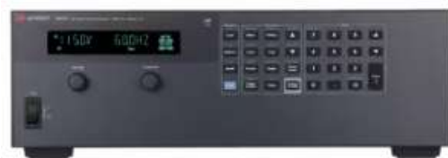
Рисунок 7 – Лабораторний блок живлення 6812C

Це досить важкий (33 кг) лінійний блок живлення змінного/постійного струму потужністю 750 ВА може обробляти будь-яку форму сигналу з аналізом напруги та якості електроенергії. Діапазон вихідної напруги цієї моделі становить 0-300 В змінного струму і 0-425 В постійного струму (6,5 А на виході).