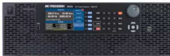
Рисунок 6 – Лабораторний блок живлення BK9833B

Вироби високому цінового діапазону (500 доларів) призначені виключно для професіоналів. Вони пропонують найвищу точність, велику кількість функцій і широкий діапазон робочих параметрів.