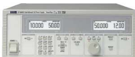
Рисунок 8 – Лабораторний блок живлення QPX600D

Це досить важкий (33 кг) лінійний блок живлення змінного/постійного струму потужністю 750 ВА може обробляти будь-яку форму сигналу з аналізом напруги та якості електроенергії. Діапазон вихідної напруги цієї моделі становить 0-300 В змінного струму і 0-425 В постійного струму (6,5 А на виході).