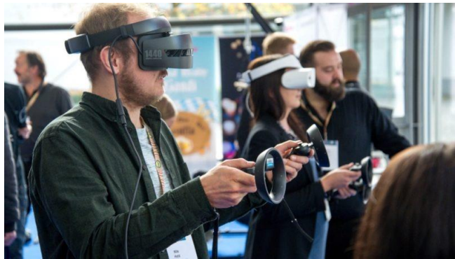
Figure 1.1 – Augmented and supplemented reality (AR/VR) technologies

MATERIALS AND RESEARCH RESULTS. ASICs are being actively implemented in augmented and augmented reality (AR/VR) technologies, which improves user interaction with visual information. In addition, process automation and the introduction of self-learning algorithms contribute to the efficiency of real-time image analysis.