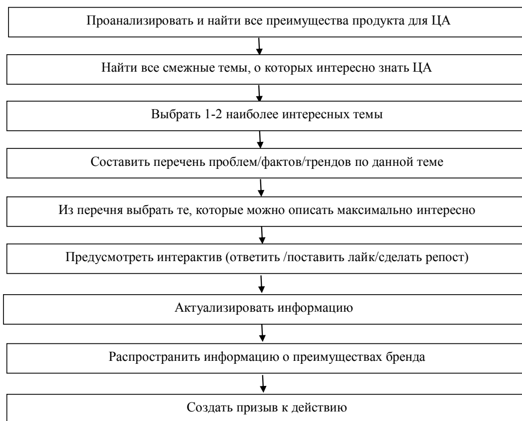
Рис. 2. Этапы формирования контент-плана

лей. С помощью SMM можно проводить интегрированные кампании, обеспечивая дополнительные охваты коммуникаций на личном уровне.