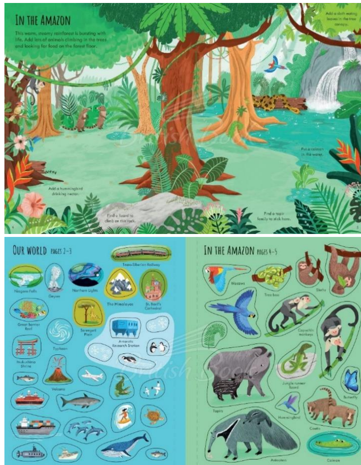
Рисунок 2 – Приклад типової сторінки з наліпками

Крім того, розвиваюча книга може містити інформаційні блоки або факти про предмети, які зображені на сторінках, що допомагає розширити знання дитини (рис. 2).