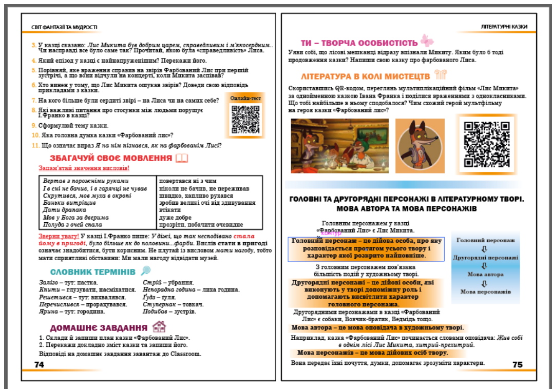
Рисунок А.2 – Редизайн сторінки підручника