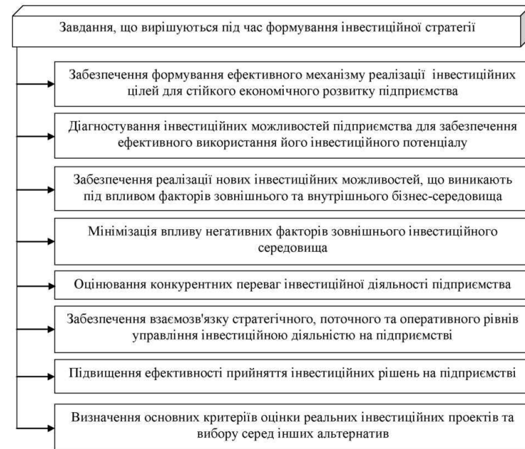
Рисунок 1 – Завдання, що вирішуються під час формування інвестиційної стратегії

Під час формування інвестиційної стратегії підприємства має бути вирішено ряд завдань, які представлено на рис. 1.