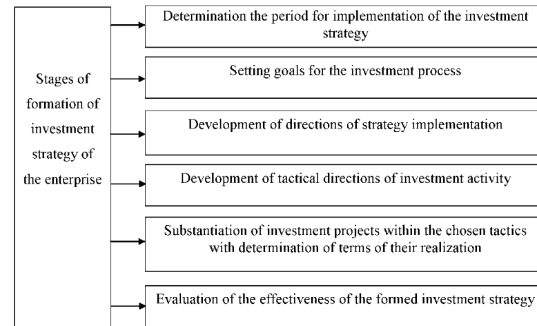
Figure 1 – Stages of formation of investment strategy of the enterprise

The process of formation the investment strategy of the enterprise contains the stages which are shown in fig. 1.