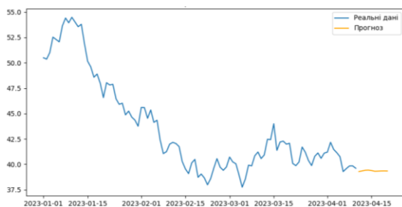
Рис. 1 – Реалізація моделі ARIMA

В ході підготовки роботи були розроблені моделі ARIMA та XGBoost, натреновані на штучно створених даних про навантаження мережі. Результати роботи моделей можна побачити на рисунках 1 і 2.