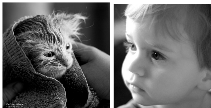
Рисунок 2 – Приклади чорно-білих фотографій

І ще кілька виразних чорно-білих фотографій – від них важко відвести погляд. Чим ефектніша сама фотографія, тим сильніше вона притягує увагу людини (рис. 2).