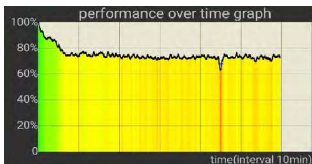
Рис. 1. Продуктивність мобільного процесора під навантаженням

Режим роботи мобільного пристрою потребує також іншої стратегії керування частотою та живленням мобільного процесора. На відміну від стаціонарного, він розрахований на короткі періоди навантаження. Навіть коли користувач упродовж тривалого часу користується браузером, навантаження також має форму короткотривалих піків: сторінка завантажується, обробляється, а потім навантаження знижується, поки не буде нової активності користувача. Це робить виправданим більш агресивний режим бусту частоти, поки процесор холодний, ніж на стаціонарному обладнанні. Стаціонарні процесори також застосовують можливість тимчасового саморозгону, поки вони холодні [15], але в мобільних процесорів цей процес значно агресивніший. Це призводить до швидкого перегріву мобільного процесора під навантаження та динамічного зниження частоти або тротлінгу. Отже, на відміну від стаціонарного, мобільний процесор за умови сталого навантаження має короткий період пікової продуктивності й потім довготривалий період зниженої на 15–25% продуктивності. Типова продуктивність мобільного процесора з плином часу показана на рис. 1.