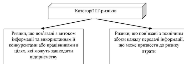
Рисунок 1 – Категорії ІТ-ризиків