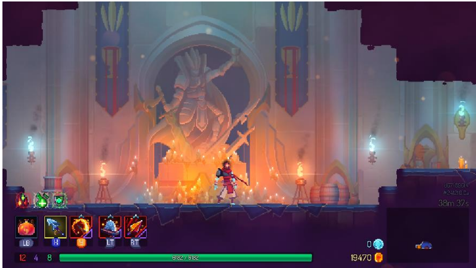
Рисунок 3 – Знімок екрана з гри Dead Cells

ускладнюють сприйняття під час швидкого руху. Дослідницький потенціал високий завдяки наявності секретів і прихованих кімнат [2]. Синергія з механіками добре реалізована, оскільки рух і бій тісно пов'язані зі структурою рівнів. Реіграбельність дуже висока завдяки процедурній генерації й великій кількості предметів.