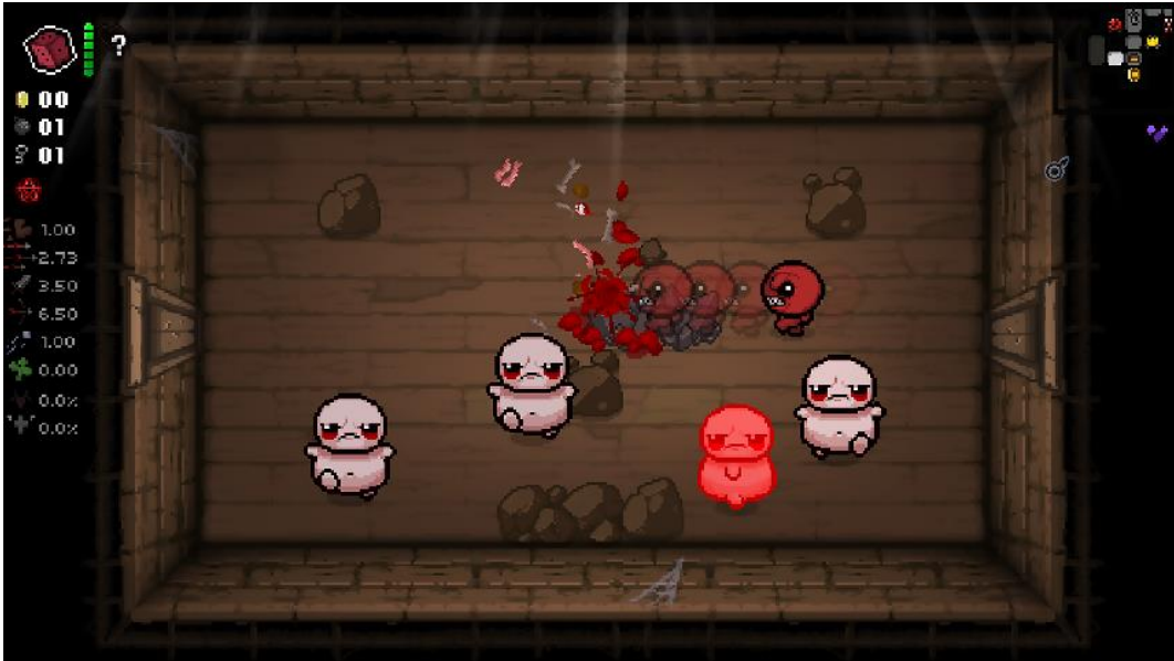
Рисунок 1 – Знімок екрана з гри The Binding of Isaac

У Hades (рис. 2) баланс рівнів є ідеальним, оскільки складність зростає поступово й підтримує відчуття прогресу. Структурна варіативність дуже висока, адже різні біоми й маршрути забезпечують унікальність кожного проходження [2]. Просторова читабельність залишається високою завдяки виразному стилю оформлення біомів. Дослідницький потенціал також високий, оскільки гравець отримує змогу обирати шляхи й відкривати нові елементи. Синергія з механіками гармонійна, адже бій і навігація логічно взаємопов'язані. Реіграбельність надзвичайно висока завдяки великому вибору зброї та системі бонусів, що урізноманітнюють проходження.