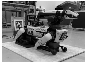
Figure 2 – Spot robot with AprilTag and reflective markers [11]

The computer vision system from Boston Dynamics, implemented in the Spot mobile robot, provides orientation in warehouses with an accuracy of 3 cm. The system uses a combination of stereo cameras and deep learning algorithms to recognize landmarks and build a real-time map of the environment (Figure 2).