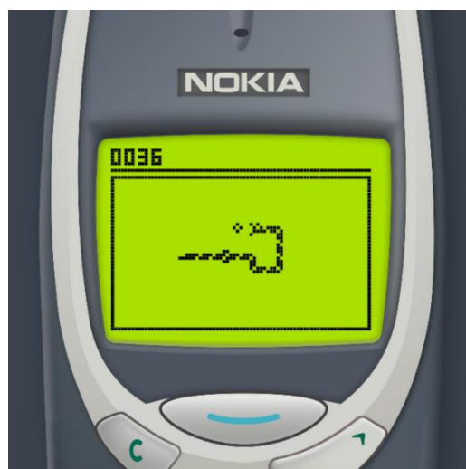
Рисунок 1 – Гра «Змійка» на Nokia 3310

Перші мобільні ігри з'явилися в 1990-х роках, коли мобільні телефони почали ставати звичним явищем. Гра «Змійка» стала однією з перших успішних мобільних ігор завдяки своїй простоті та захопливому геймплею. Вона з'явилася вже у 1976 році, ще на аркадних автоматах, але отримала широке поширення саме на мобільних телефонах, зокрема на Nokia 3310 (рис. 1)