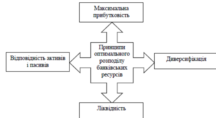
Рисунок 1 – Принципи оптимального розподілу банківських ресурсів

Одним з найважливіших напрямів управління банківськими установами є оптимальний розподіл їх ресурсів, що дозволяє ефективно використовувати фінансові ресурси для забезпечення балансу між доходністю, ризиками та ліквідністю. Це стає можливим за умов дотримання основних принципів оптимального розподілу банківських ресурсів, що зображено на рис. 1.