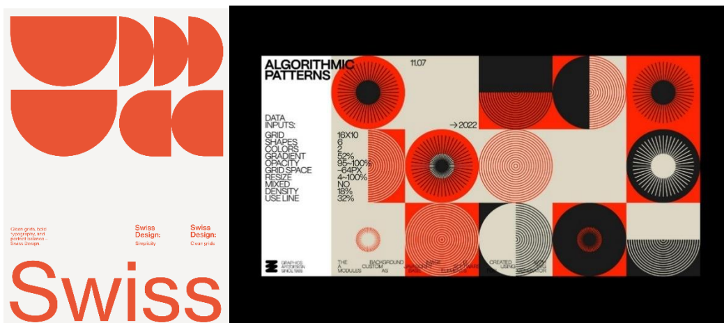
Рисунок 3 – Використання акцентної типографіки у сучасному рекламному дизайні

Суттєвий вплив на розвиток сучасної типографіки має UI/UX-дизайн. Інтерфейси мобільних застосунків та web-сервісів потребують максимальної читабельності та зручності взаємодії з текстом. Саме тому сучасна digital-типографіка орієнтується на простоту, контрастність та функціональність. Важливими параметрами стають міжрядковий інтервал, адаптивний розмір шрифту, контраст тексту та зручність навігації. Таким чином, типографіка стає не лише елементом візуального стилю, а й інструментом покращення користувацького досвіду (рис. 3).