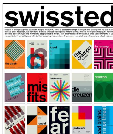
Рисунок 1 – Приклади використання типографіки як основного елемента сучасного графічного дизайну

Типографіка є одним із найважливіших елементів сучасної корпоративної айдентики. Саме шрифт формує характер бренду, впливає на сприйняття інформації та створює емоційний зв'язок між компанією й аудиторією. У сучасному графічному дизайні типографіка виконує не лише інформаційну функцію, а й стає повноцінним інструментом візуальної комунікації. За допомогою шрифту бренд може передавати власні цінності, позиціонування та стиль взаємодії зі споживачем. В умовах розвитку digital-середовища роль типографіки значно посилилася, оскільки саме текстовий контент став основою web-комунікації, соціальних мереж, мобільних застосунків та цифрової реклами (рис. 1).