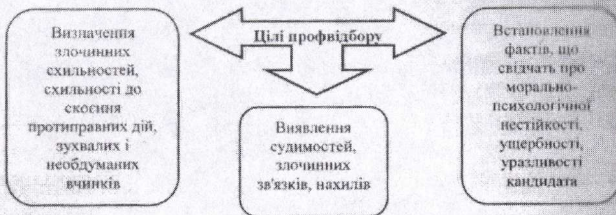
Рис. 1 Основні цілі профвідбору

правового захисту комерційної таємниці необхідно передбачити положення, які містять взаємні обов'язки адміністрації та колективу співробітників підприємства щодо забезпечення збереження комерційної таємниці.