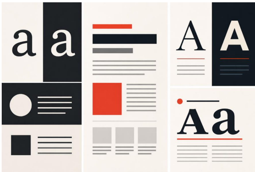
Рисунок 2 – Контраст і типографіка в дизайні

Контраст є одним із найважливіших інструментів у дизайні. Він дозволяє виділити головне, створити ієрархію та полегшити навігацію по тексту (рис. 2). Найочевиднішим прикладом є контраст між текстом і фоном: темний шрифт на світлому фоні або навпаки забезпечує високу читабельність. Однак контраст може проявлятися і в поєднанні різних шрифтів – наприклад, використання простого основного тексту разом із більш виразними заголовками.