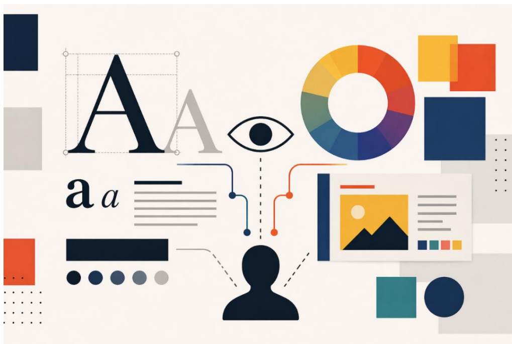
Рисунок 1 – Бачення та комунікація в дизайні

Типографіка та колір є ключовими елементами візуального дизайну, які безпосередньо впливають на сприйняття інформації користувачем [1, 2]. У сучасному середовищі, де візуальний контент відіграє провідну роль, правильне поєднання шрифтів і кольорових рішень стає важливим інструментом комунікації (рис. 1). Вони не лише забезпечують естетичну привабливість, але й формують змістове навантаження повідомлення. В роботі [3] проведено аналіз впливу кольору й типографіки на сприйняття цифрового контенту. Доведено, що їх гармонійне поєднання підвищує читабельність, емоційний відгук і ефективність комунікації. Невдалі комбінації знижують увагу користувачів і ускладнюють розуміння інформації.