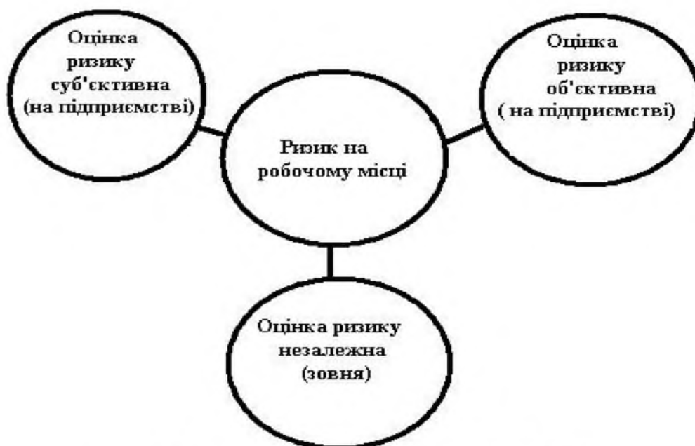
Рис. 3. Модель «СОН» аудиту ризику на робочому місці у системі «ЛМС»

Пропонується визначити рівень професійного ризику, використовуючи самоаналіз працівника, наприклад, застосовуючи метод Файн-Кінні. Вживаний в цьому методі підхід заснований на комбінації ступеня схильності працівника до впливу шкідливого чинника на робочому місці, імовірності виникнення загрози на робочому місці і наслідків для здоров'я та/або безпеки працівників в тому випадку, якщо загроза здійсниться. Оцінка ризику, яку визначатимуть з застосуванням аналізу рівня безпеки самоаналізом працівника, знаходять за формулою [14, 15]: