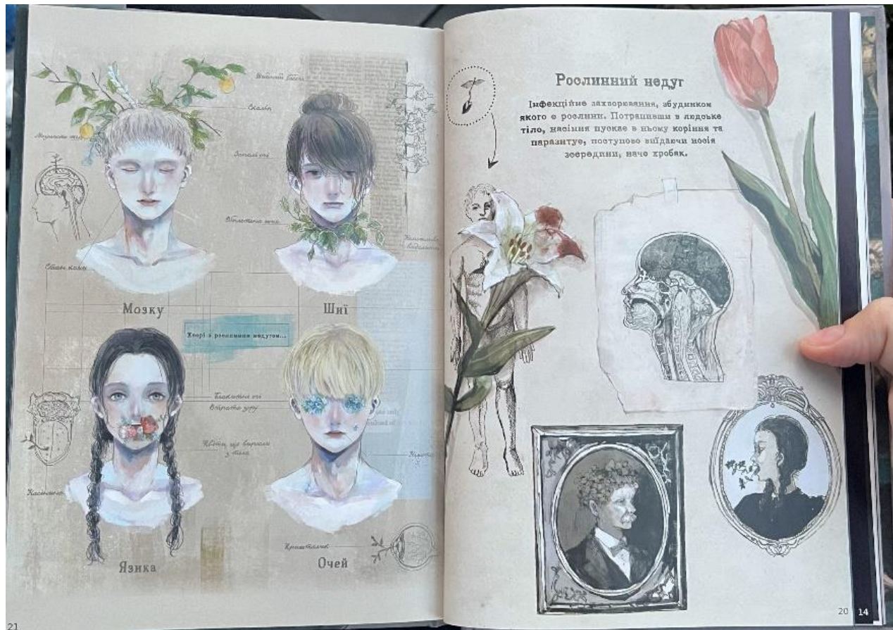
Рисунок 2 – Приклад сторінки «Чудернацька антикварна крамниця»

наявність візуальних кліше, характерних для жанру, що також може бути враховано під час розробки фентезійного артбуку. Усі ці дослідження підтверджують актуальність тематики візуального стилю, образотворчого наповнення та поліграфічного виконання у сфері дизайну мультимедійних та друкованих видань.