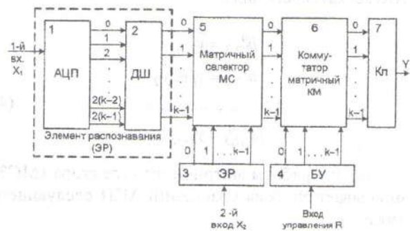
Рис. 1. Двухвходовой многозначный УФП (АКП-структура третьего рода)

На базе проведенных архитектурных исследований, изложенных в работах [16–18], а также исходя из необходимости структуризации задач при разработке интуитивно-конструктивистской теории построения многозначных структур пространственного типа, для языковых систем предложена концепция унификации (приведение к единообразию и неразрывному взаимодействию) двужаночно-многозначных аналого-цифровых средств обработки соответствующих (символьных) данных, заданных на естественном языке [18]. Настоящий подход базируется на единой методологической и целевой основе путем применения предложенных методов теории интеллекта [12] для математического описания и соответствующей формализации концепции унификации входных/выходных данных [13] и их промежуточных преобразований [19] соответствующей АКП-структурой третьего рода (рис. 1) [20–21].