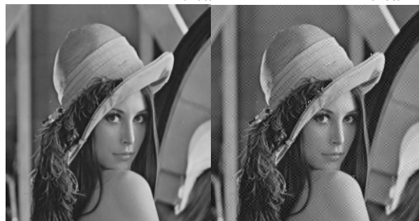
Рис. 2 — Результаты встраивания в ВО (а) и ЧО (б)

Анализ изображений (рис. 2) показывает, что встраивание в ЧО область дает большие видимые искажения контейнера, что противоречит идее скрытой передачи данных.