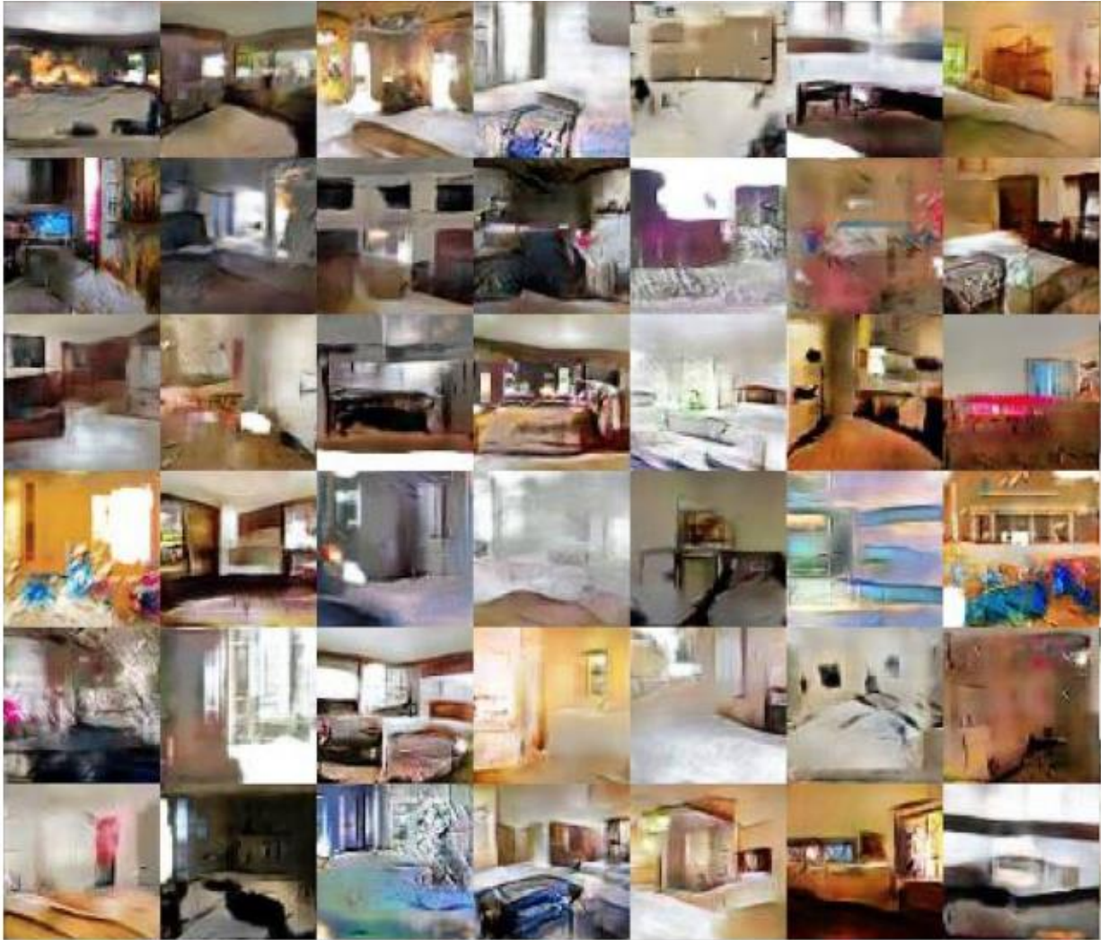
Рисунок А.2 - Приклади зображень згенерованих процедурою GAN