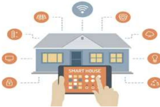
Рисунок 1 – Модульне житло з IoT

Водночас інтеграція інтелектуальних систем, автоматизації та робототехніки відкриває нові можливості для підвищення ефективності, комфорту та економічності в різних сферах людської діяльності [1-10].