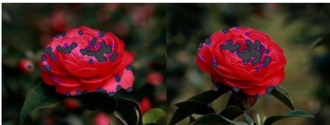
Рис.1 Координати дескрипторів КТ ORB від зображень

Метод ORB є поєднанням таких засобів, як детектор контрольних точок (КТ) Oriented FAST та дескриптор Rotated BRIEF [1]. У порівнянні з алгоритмами SIFT та SURF детектор ORB демонструє зрівняну точність виявлення КТ, меншу чутливість до шуму та у близько 100 разів більшу швидкодію.