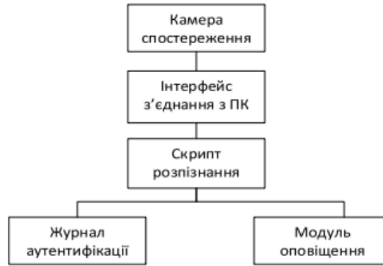
Рисунок 2 – Структурна схема програмного модуля з розпізнання обличчя з використанням нейронних мереж

Проведений аналіз існуючих методів розпізнавання наведений в табл. 1.