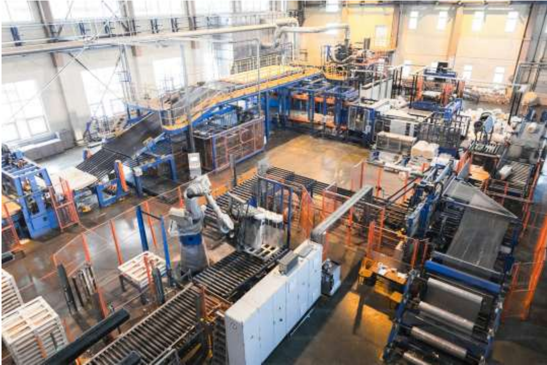
Рисунок 1 – Загальний вигляд виробничого приміщення

У виробничих приміщеннях (рис. 1) мікроклімат формується під впливом технологічних процесів, тепловиділення обладнання, вентиляції, опалення та зовнішніх умов.