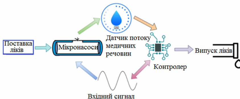
Рис. 1. Приклад системи доставки ліків за допомогою мікронасосів

2-й тип не має механічного руху і, отже, повинен перетворити немеханічний рух в механічний, щоб закачати ліки в організм людини (рис. 1).