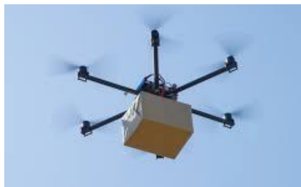
Рисунок 3 – БПЛА в логістиці

Також одним з важливих об'єктів моніторингу на аеродромі з точки зору безпеки польотів є злітно-посадкова смуга (ЗПС). В ході аналізу різних джерел із застосування безпілотних технологій виявлено, що БПЛА є сучасним і, потенційно економічно ефективним засобом для вирішування задач забезпечення польотів повітряних суден на аеродромах. Застосування БПЛА може дозволити отримати великий обсяг даних для аналізу і документування стану ЗПС, забезпечити економію часу і коштів у порівнянні з традиційним підходом, що складається в ручній зйомці фізичного стану злітно-посадкової смуги, дозволяє виявити фактичний стан покриття та знизити ймовірність виникнення авіаційних подій. Приклад БПЛА в логістиці на рис. 3.