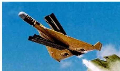
Рисунок 8 – Протирадіолокаційний БПЛА "Harpy"

Представниками ударних БЛА одноразового застосування є: "Harpy" (рис. 8) (Israeli Aircraft Industries – IAI, Ізраїль), CUTLASS (IAI, Ізраїль, і "Рейтеон", США), "Ferret", ("Northrop-Grumman", США), LEWK ("Advanced Technologies", США), "Typhoon" ("СТН-атлас", Німеччина) [7-10].