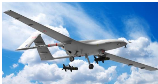
Рисунок 1 – Турецький БПЛА Bayraktar TB2

На сьогоднішньому етапі розвитку військових технологій в Україні найбільш перспективним напрямком є впровадження безпілотних систем озброєння і, в першу чергу, безпілотних літальних апаратів ударного типу. Безпілотні апарати можуть використовуватися для ведення розвідки на великих територіях, забезпечуючи важливу інформацію щодо руху ворожих сил, розташування об'єктів та інших стратегічних даних, або можуть використовуватися для систематичного моніторингу кордонів, що дозволяє вчасно виявляти незаконні перетини кордону та інші загрози безпеці. Також їх можна використовувати для доставки різних матеріалів, включаючи медичні засоби, їжу та пальне, в зони, що зазнали військових дій або мають обмежений доступ. Застосування безпілотників у військовій сфері може покращити ефективність та безпеку військових операцій, а також допомагати в управлінні ризиками та зменшенні втрат. А на сьогодні – це дуже важлива сфера для України.