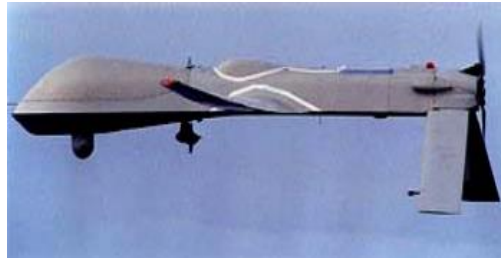
Рисунок 7 – Розвідувальний БПЛА RQ-1A "Predator"

Представниками ударних БЛА одноразового застосування є: "Harpy" (рис. 8) (Israeli Aircraft Industries – IAI, Ізраїль), CUTLASS (IAI, Ізраїль, і "Рейтеон", США), "Ferret", ("Northrop-Grumman", США), LEWK ("Advanced Technologies", США), "Typhoon" ("СТН-атлас", Німеччина) [7-10].