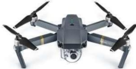
Рисунок 4 – Дрон керований GPS DJI MAVIC PRO

Використання безпілотних літальних апаратів у сільському господарстві є інновацією для України, оскільки БПЛА, у першу чергу, використовували для військових потреб і тільки після військових випробувань почалося широке застосування в сільському господарстві.