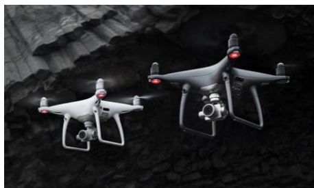
Рисунок 2 – Патрульний дрон від Axon Air

Одними з перших почали використовувати безпілотні літальні апарати для охорони правопорядку поліцейські США. Поліцейські США намагаються використовувати БПЛА і в більш складних операціях, таких як спостереження за потенційно небезпечними злочинцями. Зокрема, у червні 2018 р. компанія Ахон оголосила, що разом з DJI буде поставляти поліції США патрульних дронів за програмою Ахон Air. Ахон Air пропонує функції, які можуть виконувати БПЛА (рис. 2): шукати і рятувати людей, здійснювати реконструкцію автомобільних аварій, спостерігати за великим скупченням людей, здійснювати переслідування правопорушників і моніторинг будівель, реагувати на природні катастрофи, аналізувати місця злочинів.