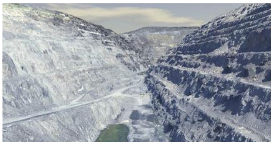
Рисунок 5 – 3D-модель місцевості, побудована на основі даних з БПЛА Raybird-3

3D-модель місцевості, побудована на основі даних з БПЛА Raybird-3 на рис. 4 [7-10].