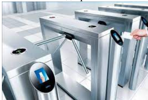
Рисунок 3 – Турнікети з вбудованим зчитувачем

Ключову роль у спрощенні взаємодії користувача з системою відіграє інтерфейс користувача, надаючи зручні та інтуїтивно зрозумілі засоби керування та моніторингу доступу. На сьогоднішній день найсучаснішим типом є мобільні додатки для платформ Android та iOS, які дозволяють користувачам керувати доступом через смартфони або планшети, отримувати повідомлення про події та зміни в системі. Також один з найпоширеніших типів інтерфейсу – це Веб-інтерфейс. Він доступний через веб-браузер та дозволяє адміністраторам керувати правами доступу, налаштуваннями системи, переглядати звіти та журнали подій. Інтерфейси користувача СКУД постійно доробляються з урахуванням простоти використання, швидкого доступу до необхідних функцій та надійності в роботі. Це дозволяє адміністраторам ефективно керувати системою та забезпечує зручність для користувачів.