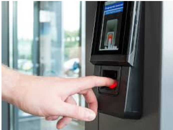
Рисунок 2 – Біометричний зчитувач СКУД

Зараз поширюється зчитування за допомогою сучасної технології NFC (Near Field Communication), можна використовувати мобільні пристрої, такі як смартфони або планшети, як засіб ідентифікації. Користувачі можуть використовувати свої мобільні пристрої для отримання доступу, несучи з собою лише один пристрій.