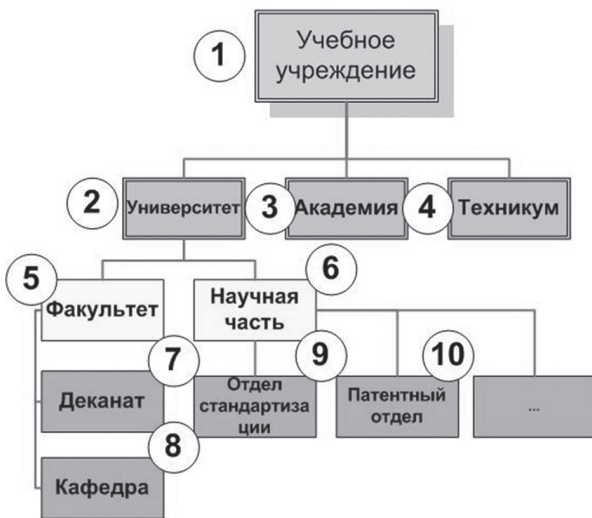
Рис. 3. Родо-видовое дерево лексико-семантического класса существительных

В зависимости от контекста родо-видовое дерево с этими же словоформами будет иметь другой вид. Для приведенного дерева (рис. 3) введем переменные и области их допустимых значений. Пусть x_1 \in \{1\}, x_2 \in \{2, 3, 4\}, x_3 \in \{5, 6\}, x_4 \in \{7, 8, 9, 10\} .