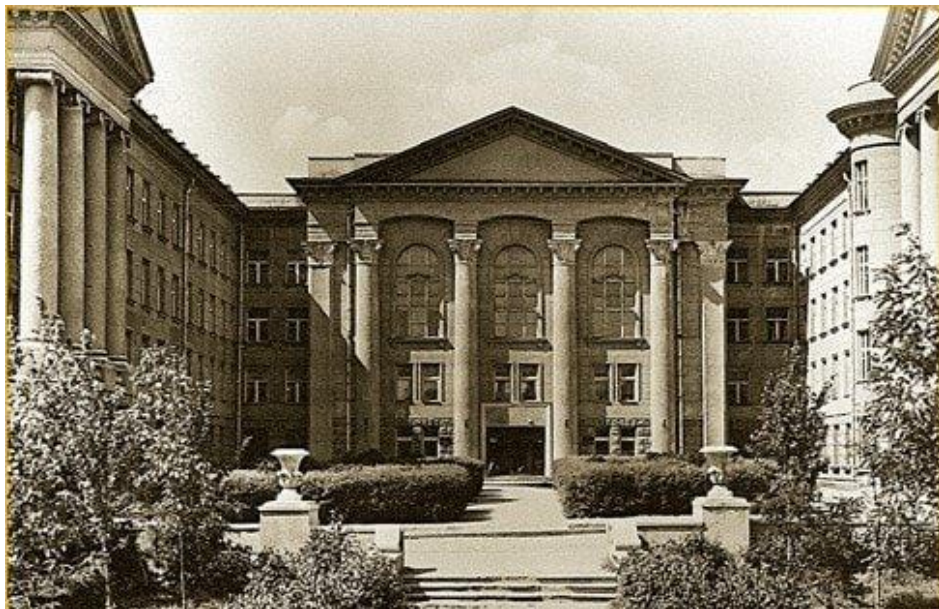
Рисунок А.4 – Приклад вхідного зображення № 4