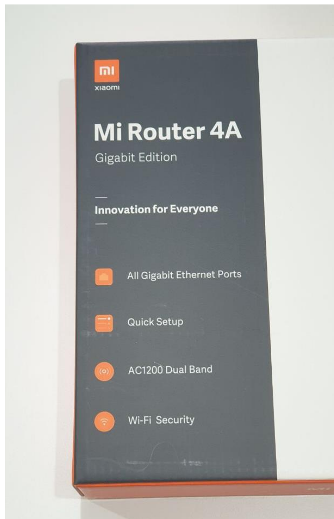
Рисунок А.2 – Приклад вхідного зображення № 2