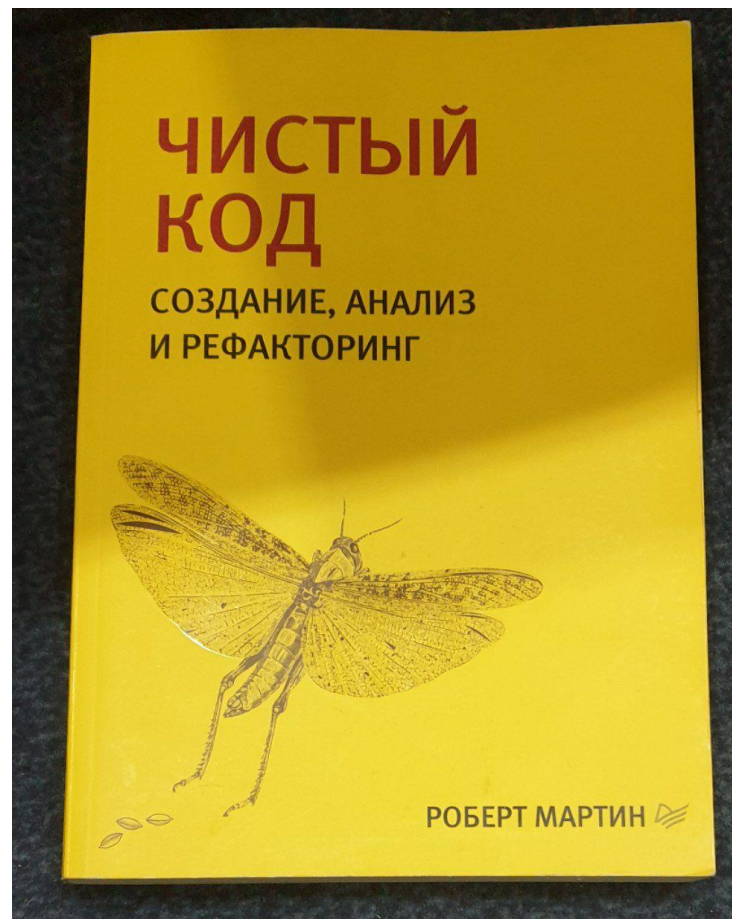
Рисунок А.3 – Приклад вхідного зображення № 3