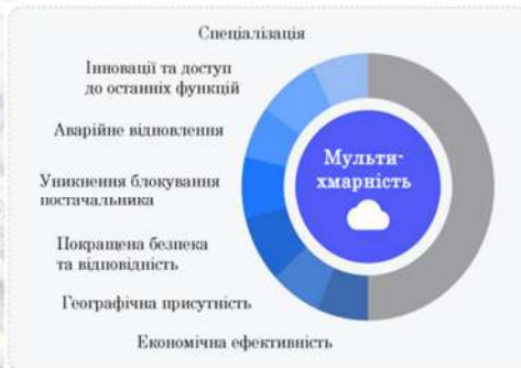
Переваги мультихмарної стратегії

Мультихмарна стратегія – це підхід, коли компанія використовує комбінацію публічних, приватних та гібридних хмар. Це дозволяє використовувати найкращі функції та сервіси хмарних провайдерів для конкретних бізнес-операцій та відповідати нормативним вимогам.