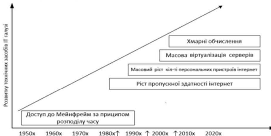
Рис. 1. Розвиток IT галузі

Згідно з визначенням Національного інституту стандартів і технології (NIST) США, Хмарні обчислення (від англ. Cloud Computing) — це модель забезпечення повсюдного та зручного доступу на вимогу, через мережу до спільного пулу обчислювальних ресурсів, що підлягають налаштуванню (наприклад, до комунікаційних мереж, серверів, засобів збереження даних, прикладних програм та сервісів), і які можуть бути оперативно надані та вивільнені з мінімальними управлінськими затратами та зверненнями до провайдера [1]. Першим же кроком до втілення хмарних обчислень можна вважати появу ASP (Application service provider - провайдери послуг доступу до додатків) у другій половині 1990х років. ASP можна вважати одними із перших SaaS сервісів. Пальма першості належить сервісу електронної пошти від компанії Hotmail. Але відсутність на той час широких каналів інтернет та технологій віртуалізації стали на перепоні - за відсутності швидких та стабільних каналів інтернет користувачі не могли отримати якісні послуги, а без технологій віртуалізації неможливо було ефективно та гнучко розподіляти ресурси та масштабувати сервіси (рис. 1) [1].