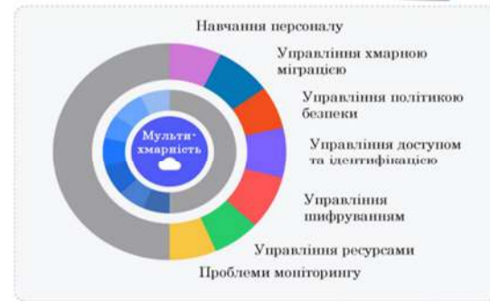
Аспекти мультихмарної безпеки