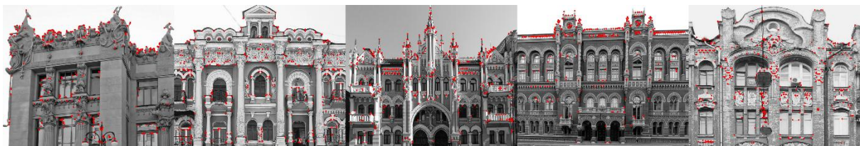
Рисунок 1 – Виявлені ключові точки на зображеннях

На рис. 1 наведено зображення, де червоним кольором позначено 500 відібраних ключових точок BRISK.