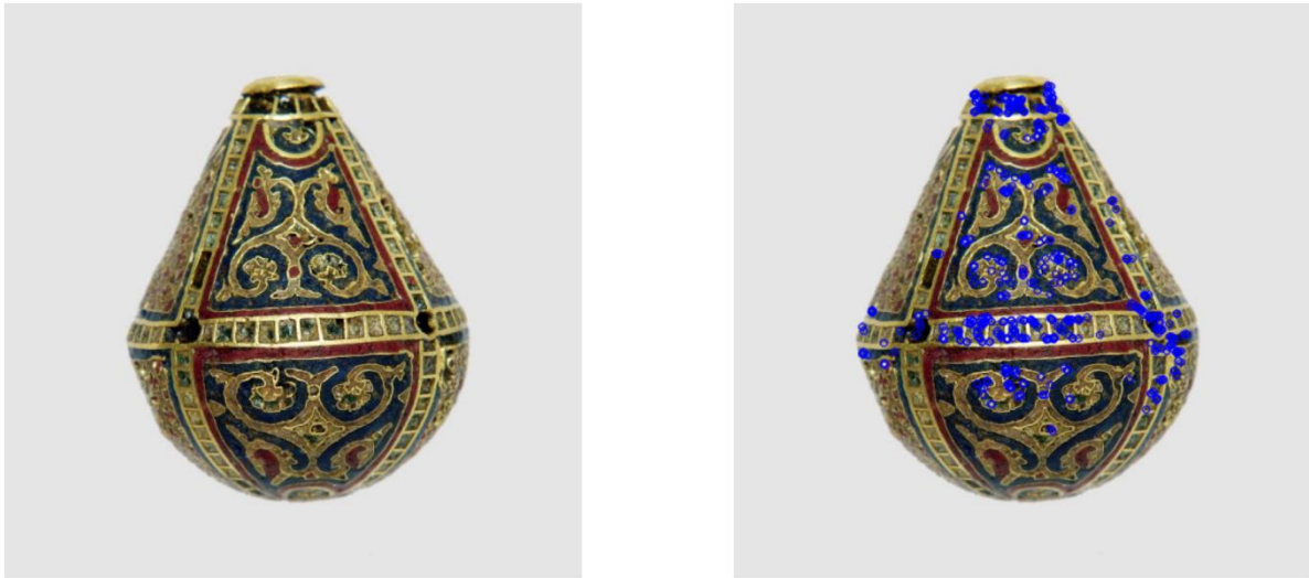
Рисунок 1 – Зображення еталону і координати ORB-дескрипторів

У ході досліджень отримано результати класифікації з параметрами редукції для 50, 25, 10 найінформативніших ознак із 500.