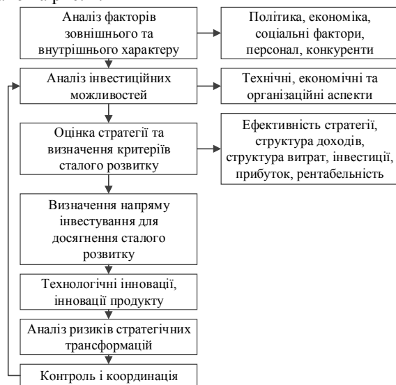
Рис. 2. Графічна модель механізму розробки та управління реалізацією стратегії промислового підприємства (побудовано авторами на основі даних [6-8])

Щоб ризикувати та точніше оцінювати бізнес, запропоновано рекомендації. Модель механізму стратегічного управління промисловим підприємством подано на рис. 2.