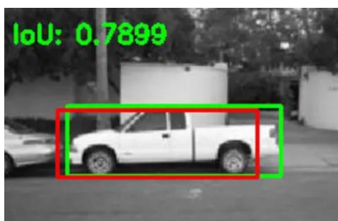
Рисунок 1 – Приклад обмежувальної рамки

Комірка, яка знаходиться в центрі, відповідальна за детектування даного об'єкту. Кожна комірка передбачує обмежувальні рамки об'єктів та рівень впевненості розпізнавання об'єкту, який визначається від 0.0 до 1.0, де 0.0 – комірка не містить об'єкту, 1.0 – найвищий ступінь впевненості моделі, що комірка містить об'єкт. Критерій IoU (Intersection Over Union) відповідає за прогнозування обмежувальних прямокутників і їх балів достовірності та допомагає описати, як блоки перекриваються. IoU розраховується як площа перекриття пересічних обмежувальних рамок, поділена на загальну площу перетину повних обмежувальних рамок для аналізованого об'єкта [3]. На рис. 1 відображено обмежувальні рамки з прогнозованим коефіцієнтом класу.