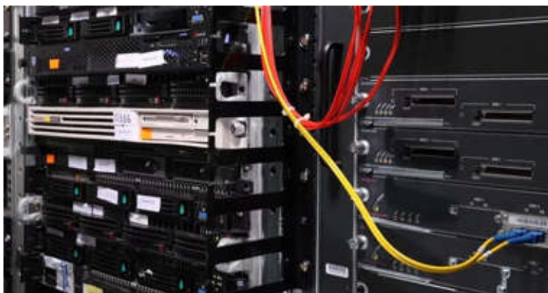
Рисунок 2 – Стойки звукового оборудования

Технический регламент звукового сопровождения на стадионе.