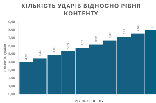
Рисунок 1 – діаграма зміни кількості необхідних ударів для рівня контенту

де a_n – кількість ударів, необхідних для знищення жука n-го рівня; 4 – початкова кількість ударів (для 1-го рівня).