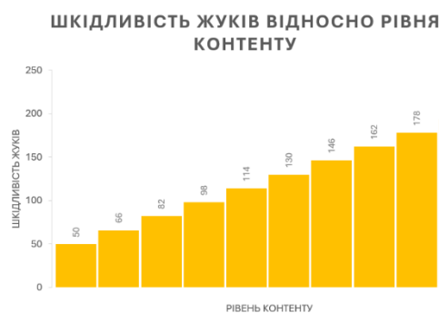
Рисунок 2 – Діаграма зміни шкідливості жуків для рівня контенту

де b_n – це шкода або шкідливість жука на рівні n; 50 – початкове значення шкоди на рівні 1 (це базовий рівень).