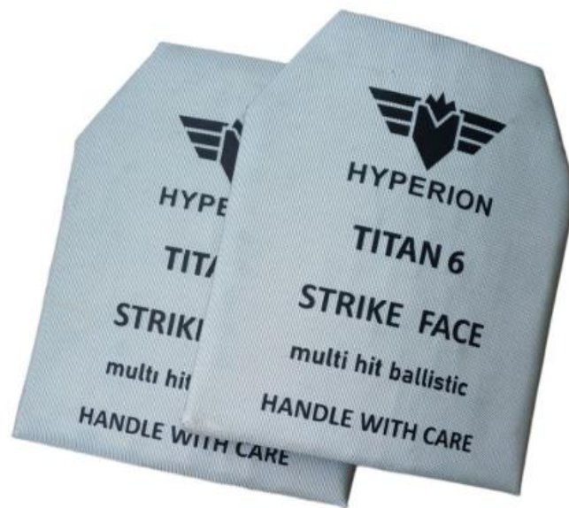
Рисунок 1.6 – Керамічні плити для бронезахисту

Основною функцією керамічних пластин є руйнування сердечника кулі та розподіл кінетичної енергії удару на велику площу, що значно знижує ймовірність пробивання та мінімізує травми. Керамічні елементи в бронежилетах зазвичай використовуються в поєднанні з амортизуючими шарами полімерних волокон, таких як арамід або поліетилен високої щільності, що забезпечує додатковий захист.