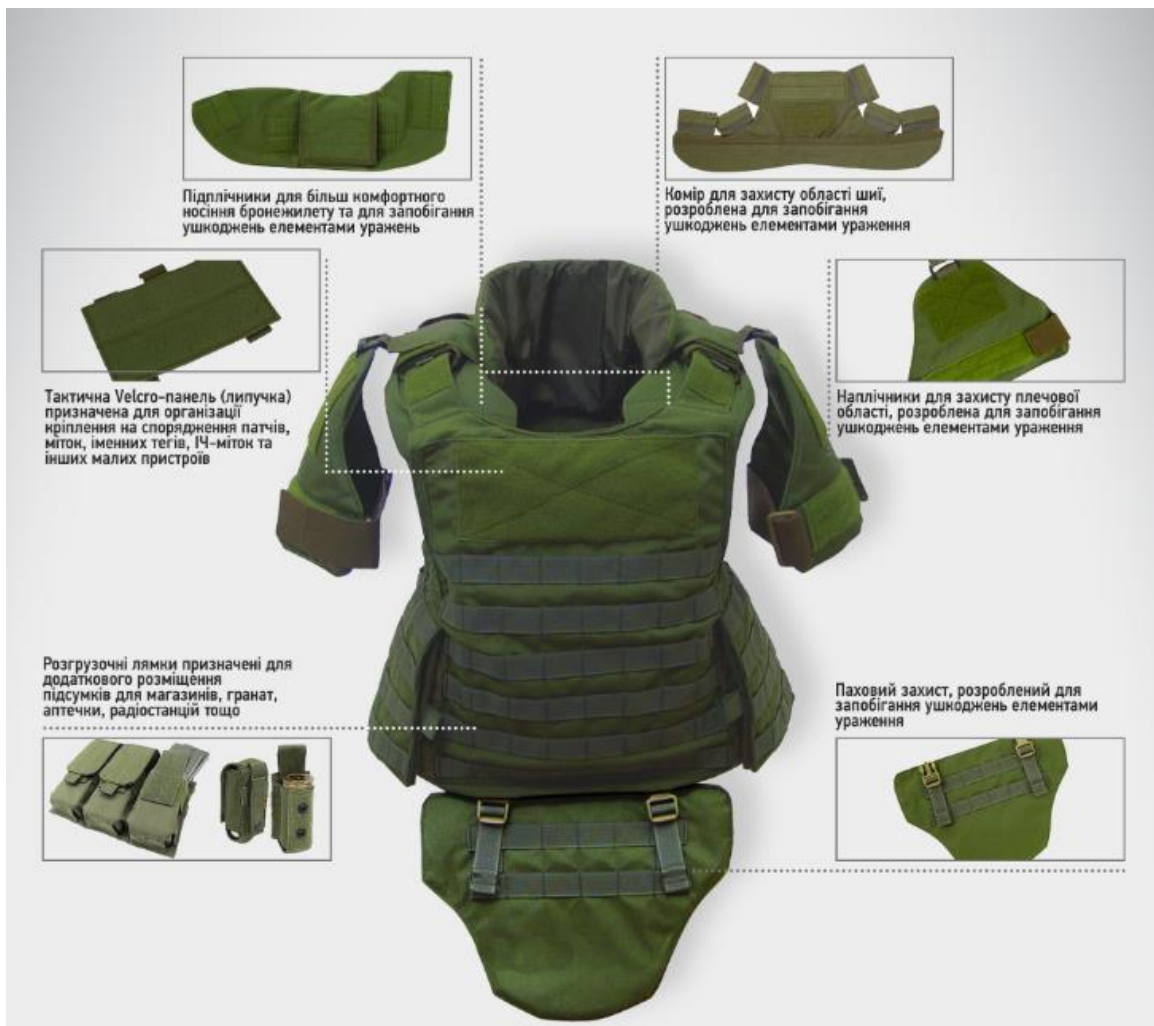
Рисунок 1.5 – Жорсткий бронежилет