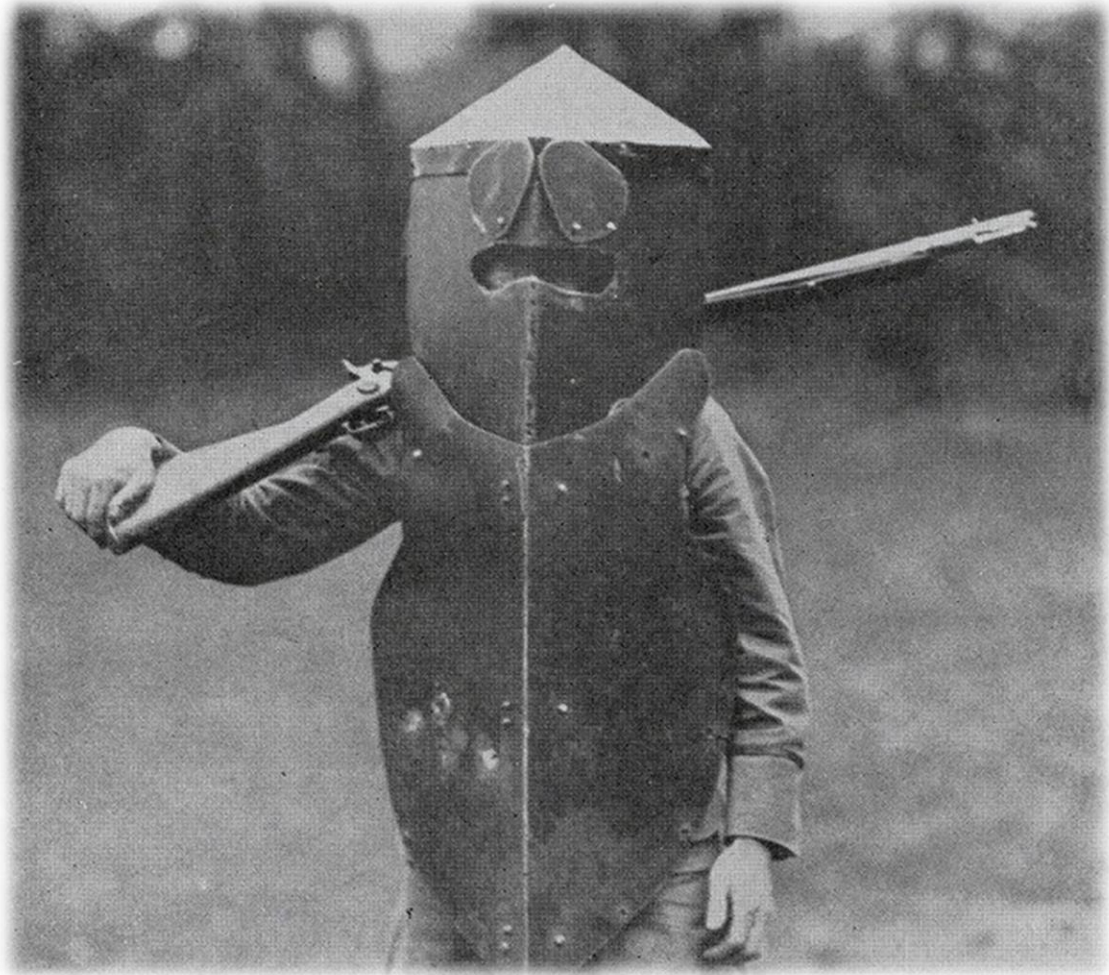
Рисунок 1.3 – Броня Брюстера

важкі, менш рухливі та незручні. Цей бронезилет який витримував попадання кулі патрона .303 калібру (англійський унітарний гвинтівочний патрон) називався Броня Брюстера (англ. Brewster Body Shield) представлений на рисунку 1.3, комплект із нагрудника і шолома важив 18 кілограмів.