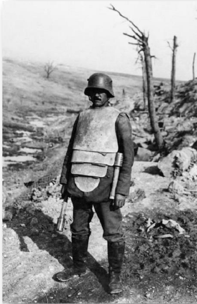
Рисунок 1.2 – Бронежилет-кіраса Sappenpanzer

Sappenpanzer - кірасоподібний обладунок із захистом живота і паху. Вироблявся з 1916 року, мав товщину 2,3 міліметра. Важив близько 8 кілограмів. У 1918 році зазнав змін - збільшилася товщина броні до 7,1 міліметра, вага збільшилася до 11 кілограмів. Залишили тільки одну кірасу, інший додатковий захист забрали. Така броня тримала постріл із гвинтівки не ближче 200 метрів. Її головне призначення - захист від осколків.