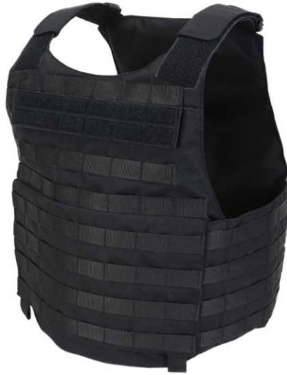
Рисунок 1.4 – Легкий бронежилет Велес М-4