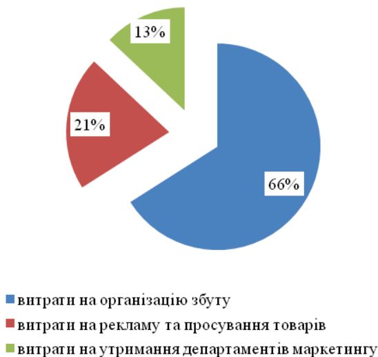
Рис. 3. Структура маркетингового бюджету ТОВ «НРП» в 2018 р., %

Загалом в структурі маркетингового бюджету ТОВ «НРП» (рис. 3) домінують витрати на управління збутом продукції (до складу цих витрат входять витрати на утримання транспортної та складської інфраструктури ТОВ «НРП», витрати на виплату заробітної плати менеджерам по збуту та торговельним працівникам, витрати на транспортування продукції), частка яких в сукупному маркетинговому бюджеті складає 66 %.