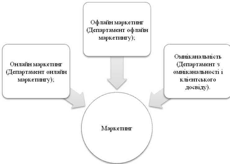
Рис. 1. Маркетингова діяльність підприємства Джерело: розроблено автором на підставі [3]

Організаційна структура маркетингу яка орієнтується на покупця (групу покупців) базується на проведенні маркетингових заходів і маркетингової діяльності, які відрізняються за цільовими групами покупців. Ця структура застосовується через неоднорідний попит (постійний контакт з клієнтами, знання звичок і прихильностей покупців, обслуговування цільових груп покупців тощо).