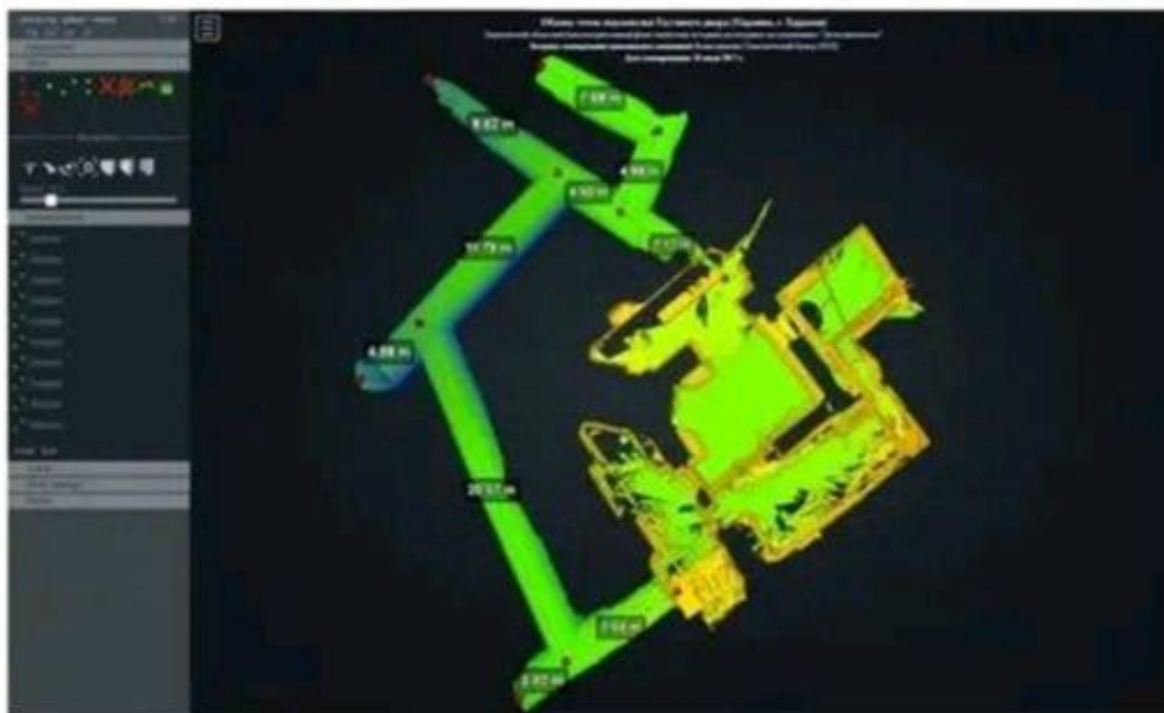
Рис. 2 – 3D сканування підземель Гостинного двору

Незважаючи на те, що такий втаємничений та загадковий бік міського будівництва, як старовинні підземні споруди, завжди викликав цікавість досить широкого загалу [3], предметом наукового дослідження харківські підземелля ставали дуже рідко [1; 4; 5]. Серед дослідників можна виокремити Харківський фонд сприяння історико-культурним дослідженням «Діти підземелля», який займався вивченням старовинних підземних об'єктів у Харківській області та Україні в цілому з 2005 р. Було досліджено та внесено до реєстру старовинних штучних підземних споруд більше тридцяти об'єктів, з них вісім – в історичному центрі Харкова.