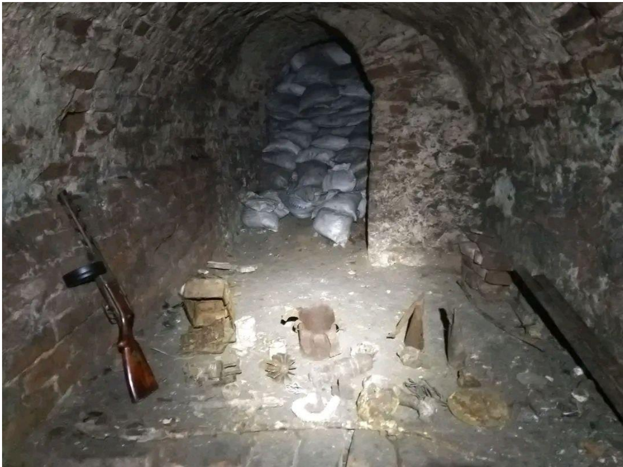
Рис. 3 – Підземелля Гостинного двору

Третій підземний маршрут біля смт Липці був покинутою гірничою виробкою довжиною близько 650 м, 420 з яких могли стати майданчиком цікавого квесту для туристів, які не бояться замкнутого простору й мають добру фізичну форму, бо мандрівка вузькими та низькими заплутаними проходами є досить виснажливою.