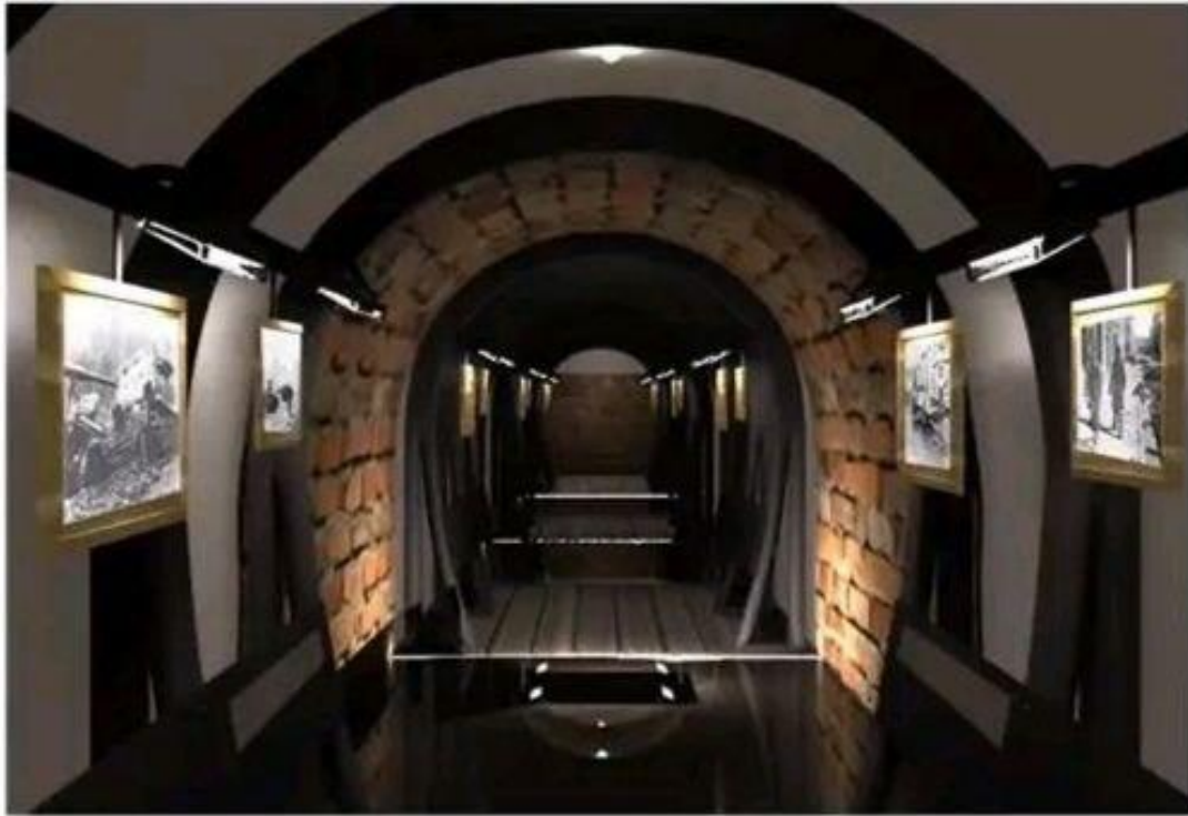
Рис. 4 – Проект музеєфікації підземель Гостинного двору

Виходячи з нової історичної реальності, подальша музеєфікація старовинних підземель у місті Харкові потребуватиме залучення також фахівців, які зможуть провести корекцію вже наявних проєктних рішень з урахуванням можливого використання зазначених об'єктів у якості сховищ для мирного населення.