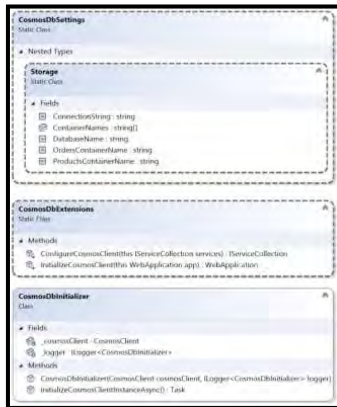
Рис. 3. Основні класи для роботи з базою даних