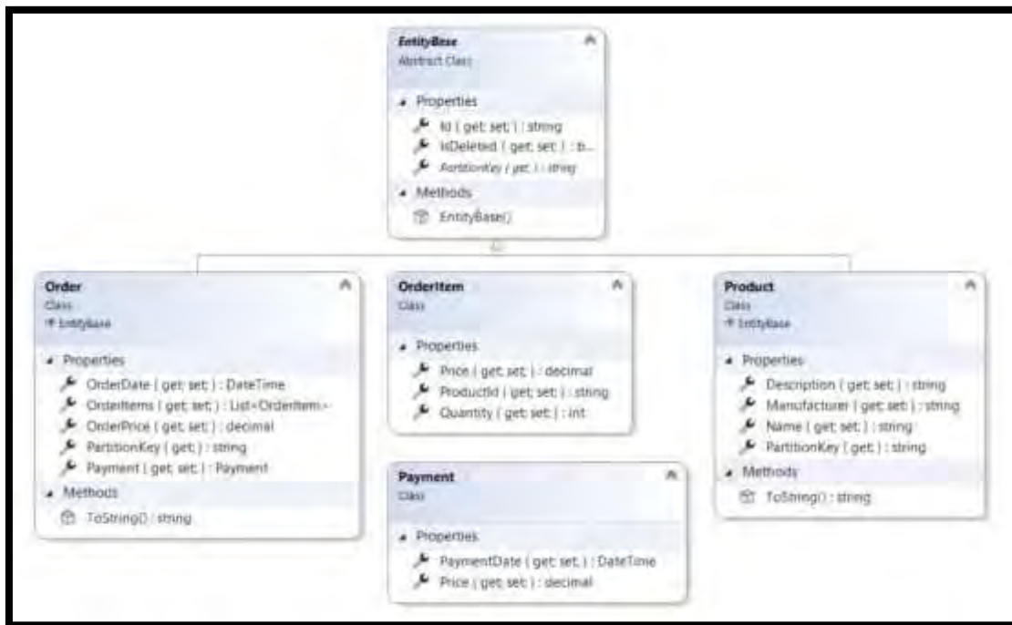
Рис. 2. Діаграма базових класів для обраної предметної сфери

Для того, щоб дослідження різних програмних реалізацій було достовірним, розроблено основні класи, які виконують параметри підключення та налаштування БД, що мають однакову структуру, а саме класи CosmosDbSettings , CosmosDbExtensions та CosmosDbInitializer (рис. 3).