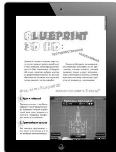
Рис. 4. Журнал на екрані планшетного комп'ютеру

Другий спосіб тестування проекту електронного інтерактивного журналу передбачає перегляд журналу на планшетному комп'ютері. У якості планшету був обраний iPad (рис. 4).