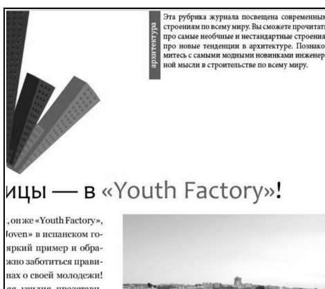
Рис. 3. Приклад використання прокручуваного фрейму

В електронному журналі даний інструмент використовується не за прямим призначенням, а для створення візуальних закладок. В кожній рубриці, якщо потягнути за прямокутник з написом рубрики вправо, можна побачити опис рубрики (рис. 3).