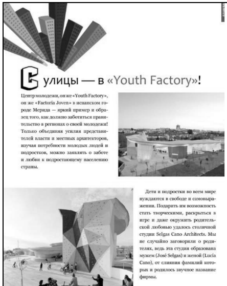
Рис. 2. Приклад зверстаної статті рубрики «Архітектура»

Етап 5: налаштування робочого середовища та програмна реалізація інтерактивних елементів. Для того, щоб «оживити» електронний журнал доцільно використовувати наступні інтерактивні елементи: гіперпосилання, слайд-шоу, послідовність зображень, аудіо та відео, панорами, зсув та масштабування, прокручуваний фрейм.