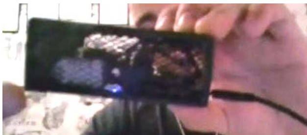
Рис. 1. Розроблений пристрій MeteoAssistant

хист внутрішніх елементів від пилу та вологи, що допомагає підвищити надійність та тривалість експлуатації системи.